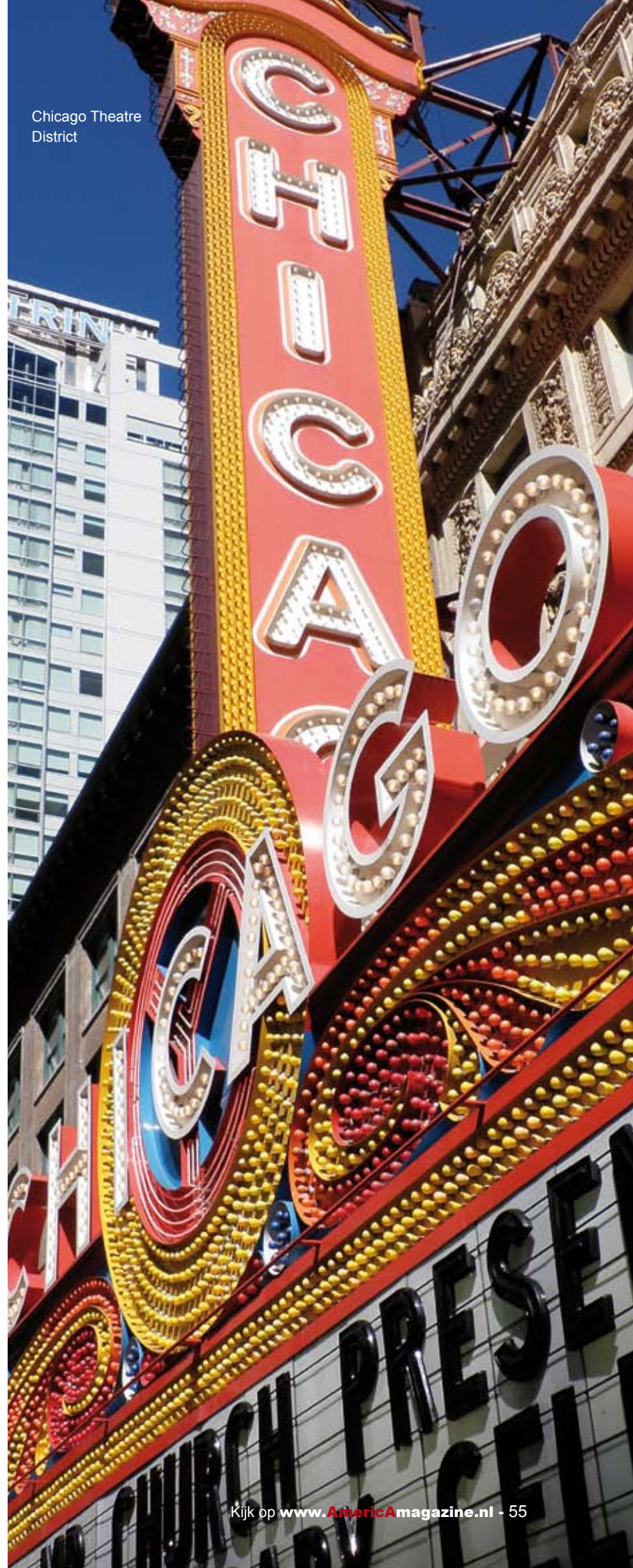
Chicago Theatre District