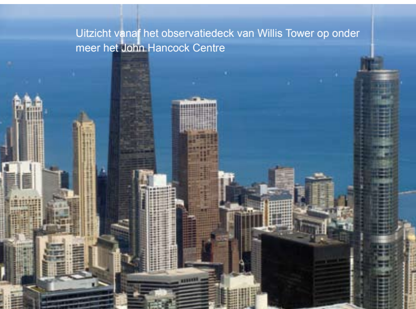
Uitzicht vanaf het observatiedek van Willis Tower op onder meer het John Hancock Centre