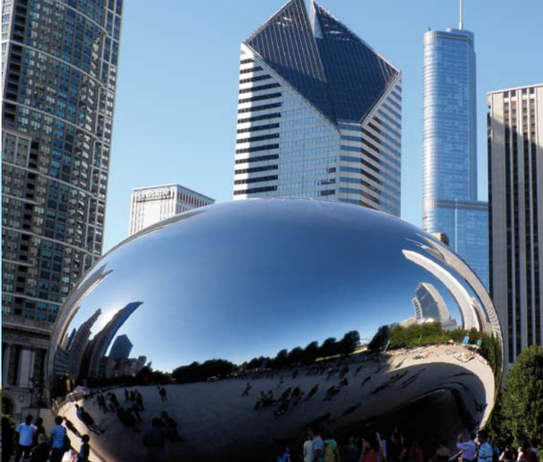
Links: Hancock Centre Rechts: Cloud Gate in het Millennium Park

“ M y kind of town, Chicago is. My kind of people too. People who smile at you.” Frank Sinatra maakte het liedje populair in de jaren zestig. En een van de eerste dingen die opvallen bij een bezoek aan de grootste stad van de staat Illinois is dat Frank gelijk had. De mensen in Chicago zijn vriendelijk en behulpzaam. Zo kan het je maar zo overkomen dat iemand spontaan aanbiedt je te helpen om je koffer even te dragen als hij je ziet sjouwen. En dat terwijl Chicago met bijna drie miljoen inwoners de op twee na grootste stad van de Verenigde Staten is.