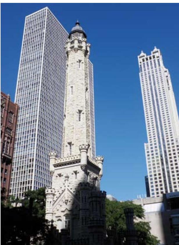
Links: De Water Tower is een van de weinige overblijfselen van The Great Fire Rechts: Chicago wordt aan de oostkant begrensd door Lake Michigan

Blues en jazz zijn onlosmakelijk verbonden met Chicago. Een van de bekendste muziekclubs in de stad is Buddy Guy's Legends, waar al ruim twintig jaar lang avond aan avond livemuziek gespeeld wordt. Soms staan er bekende muzikanten op het podium en af en toe jamt aanstormend talent er een avond lustig op >